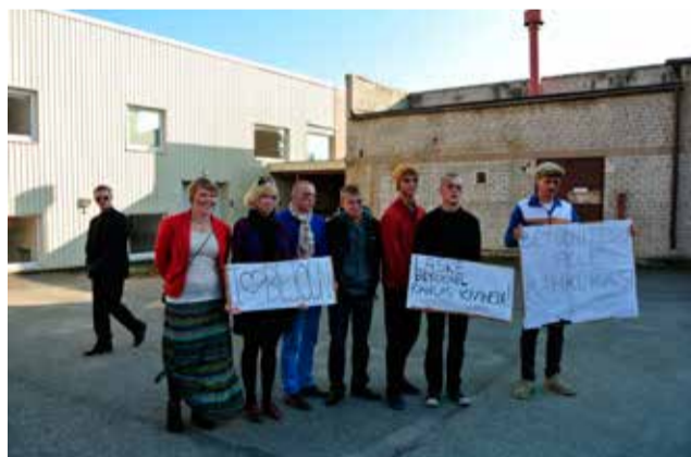
Betooni rahu rikkujad said sinise silma