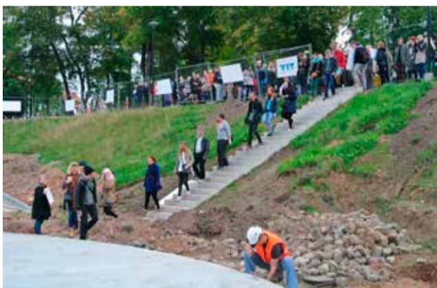
Rongkäik suundub valmivate Viljandi laululavale regilaulu laulma