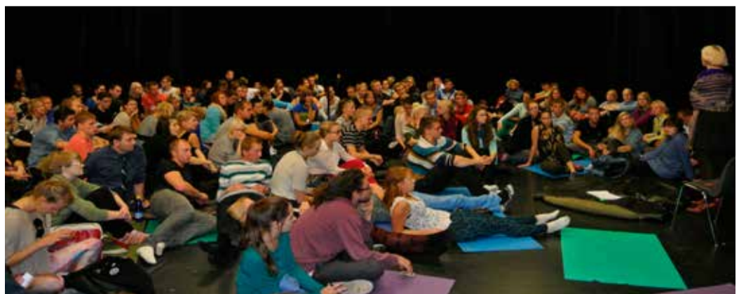
Perfonksipäeva muljete jagamine