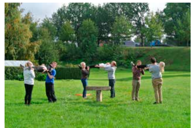
Betooni kolmainsus tudengite tõlgenduses