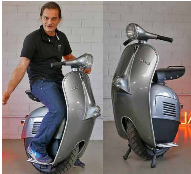
Monoratas kui üks võimalik liikumisvahend