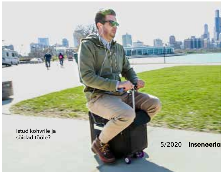
Istud kohvile ja sõidad tööle?