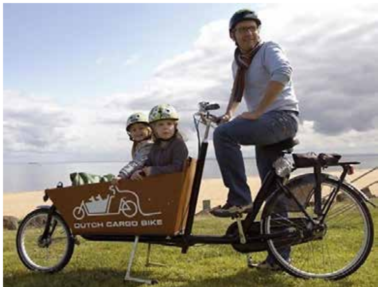
Ratas, mis võimaldab viia pere noorimaid lõbusõidule